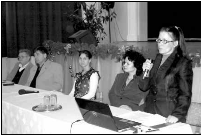
Az iskolák képviselői bemutatták intézményeiket

A Békés Megyei Kormányhivatal Munkaügyi Központjának Sarkadi Kirendeltségével történt együttműködés eredményeképpen a kistérség tanulói részt vettek a 2012. november 8-án és 9-én megrendezett megyei Pályaválasztási Vásáron, melynek mintájára kistérségi pályaválasztási délutánt szerveztünk 2012. december 5-én. A rendezvény célja a pályaválasztás és a szakmák megismertetése volt, illetve a Munkaügyi Központ tájékoztatót tartott a fiatalok által igénybe vehető támogatási formákról és a TOP 10 szakmáról.