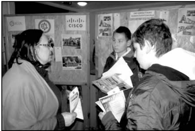
A sarkadi Ady Endre - Bay Zoltán Középiskola és Kollégium „standja”