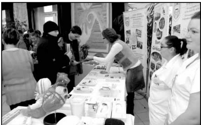
A Göndöcs Benedek Középszakiskola, Szakiskola és Kollégium bemutatója

A projekt az Európai Unió támogatásával, az Európai Szociális Alap társfinanszírozásával valósul meg.