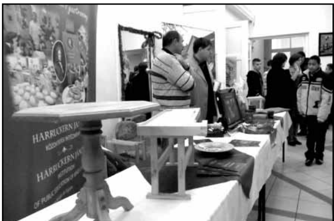
A Békés Megyei Harruckern János Közoktatási Intézmény látóival