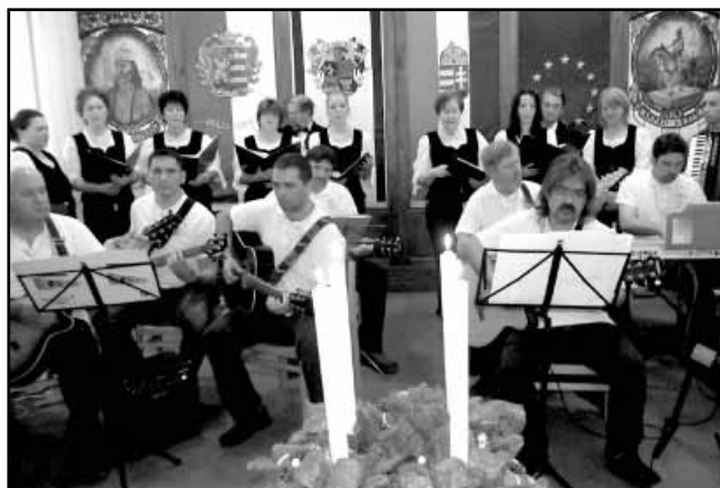
Az ünnepi műsor zenei közreműködői a Kónya Sándor Kamarakórus és a Sarkadi Gitárklub voltak

A következő napirendi pontban a Képviselő-testület 2013. esztendői munkatervéről született döntés, melynek értelmében tizenegy munkaiüléssel számolt a munkaterv, ahogy a 2012-es esztendő (folytatás a 2. oldalán)