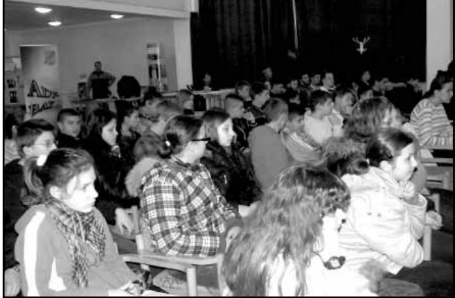
A kistérség általános iskoláinak végzős diákjai

A Sarkad és környéke Többcélú Kistérségi Társulás által megpályázott és elnyert TAMOP-5.2.3-A-11/1-2011-0002 „Együtt gyermekeink jövőjéért” – a Sarkadi Kistérség integrált programja elnevezésű projekt „Pályaorientáció” programelem keretén belül megszervezett tevékenységekkel kívánt segítséget nyújtani a továbbtanulás előtt álló diákoknak, a megfelelő szakma és képző intézmény kiválasztásában.