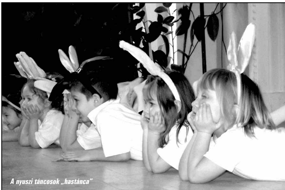
A nyuszi táncosok „hastánca”

A TÁMOP 3.1.4.-08/2-2008-0055 „Kompetencia alapú oktatás bevezetése és szegregációmentes együttnevelési környezet kialakítása a sarkadi oktatási intézményekben” című pályázat innovációjának zárásaként NYUSZI-BULIT rendezett az Epreskert Utcai Óvoda Szülői Munkaközössége és a dolgozói kollektívája.