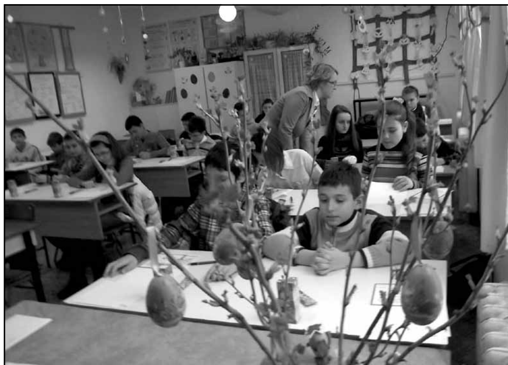
A húsvéti díszletekre pillantva a gyerekekben oldódott a verseny feszültsége