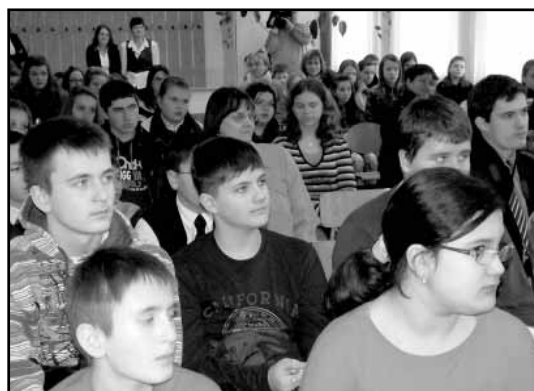
A versenyzők a megnyitón...