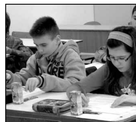
...és amint a feladatlapokkal ismerkednek