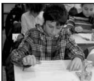
Az idő sürgető „tényező” volt...