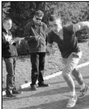
Klasszikus sportág a futás