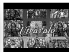
Katolikus gondolatok öt percben