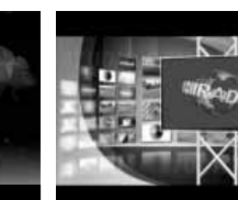
Friss közéleti hírek (ism.)