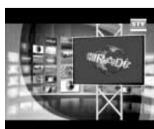
Friss közéleti hírek