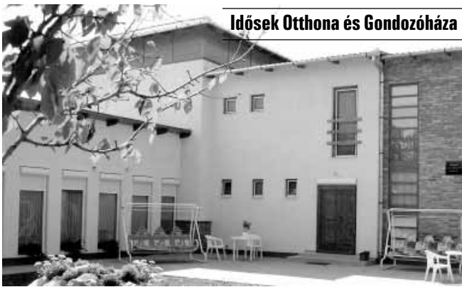
Idősek Otthona és Gondozóháza

A Gyulai u. 8. szám alatti Idősek Otthona és Gondozóháza akadálymentesített, parkosított, kellemes környezetben, családi légkörben, emelt szintű 2 ágyas, fürdőszobás szobákkal várja az idősek jelentkezését. Az otthon komplex, személyre szóló teljes körű ellátás, aktív pihenés keretében biztosítja lakói számára a kiegyensúlyozott életet.