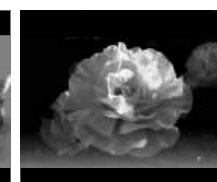
Nyugdíjasok anyáknapjára ünnepsége