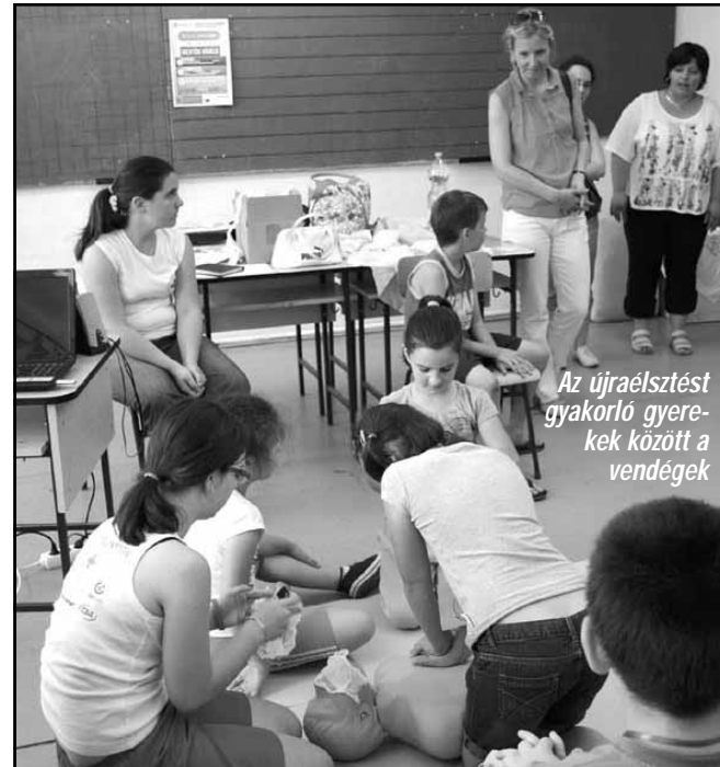
Az újraélesztést gyakorló gyerekek között a vendégek