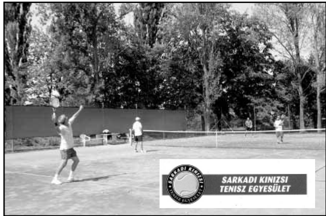
SARKADI KINIZSI TENISZ EGYESÜLET

A megyei szabadtéri férfi tenisz csapatbajnokság 4-es döntőjébe a legtöbb pontot gyűjtve bejutott a Sarkadi Kinizsi TE. A sorsolás szerint szeptember 8-án (szombaton) Békéscsabában csapatát, míg 9-én (vasárnap) Mezőberény csapatát látják vendégül a sarkadi teniszeseik. Szeptember 15-én Vésztő csapata jön Sarkadra, amelyik az összesítésben a ponttáblán közvetlenül Sarkad mögött áll. A mérkőzések kezdési időpontja minden alkalommal 9.00 óra.